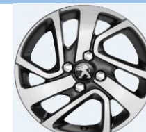
Лети джанти 15"