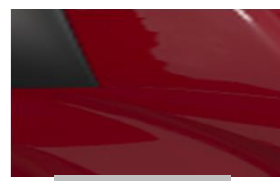
Червен Rouge Ardent