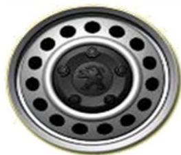
Стоманена джанта с черни болтове 16"