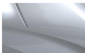
Сив Gris Aluminium