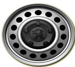
Стоманена джанта с черни болтове 17"