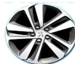
Алуминиева джанта 17"