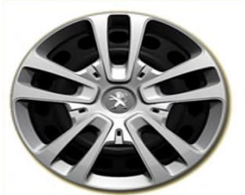
Тасове Full Cover