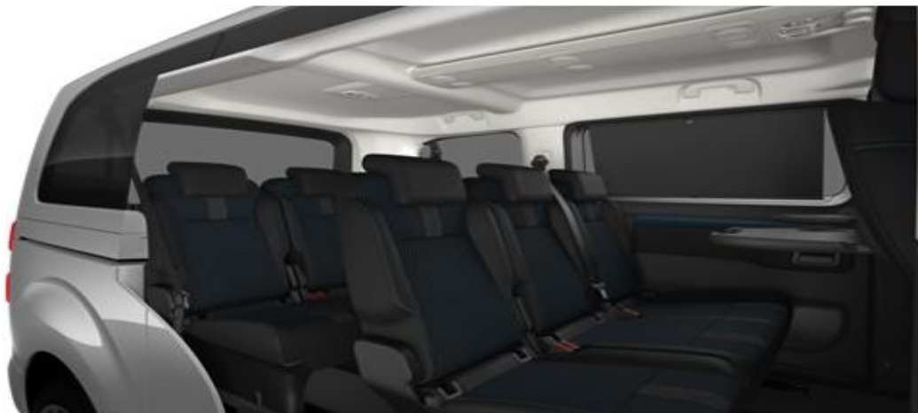
Текстил Chaine & Trame Cranv сиво и синьо - код 44FY