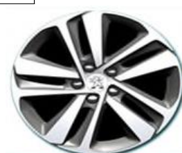
Алуминиеви джанти 17"