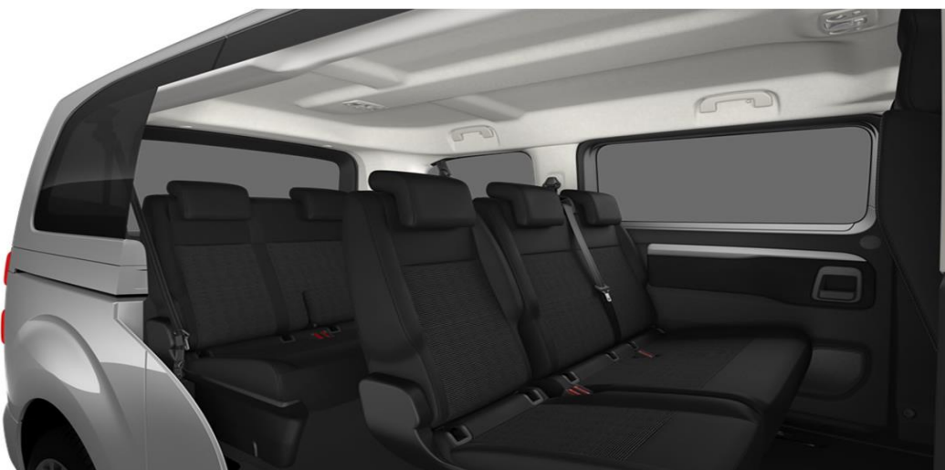
Текстил Tri-ton curitiba в черно и сиво - код 43FT