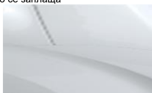
Бял Blanc Vanquise