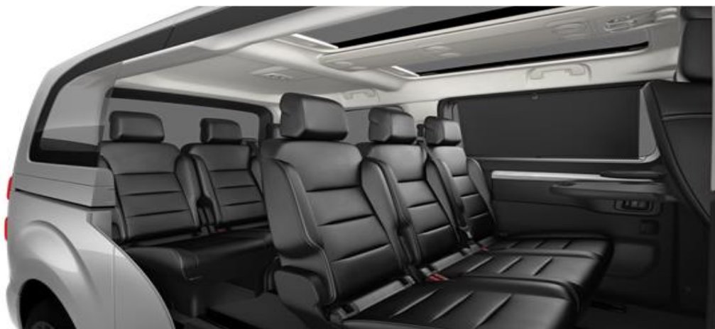
Кожа Claudia черна - код CYFX