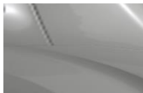
Сив Silky Grey