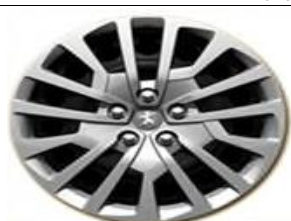
Тасове Full Cover 17"